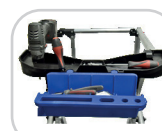
Multicases 382202 36.00 € HT