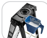
Mini bac 382200 27.50 € HT