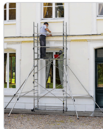
Speed'up XL hauteur du plancher 3 m