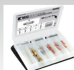
Coffret torche MB15 041226