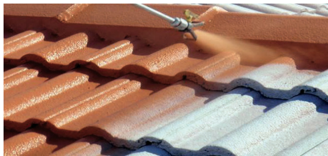
Idéal pour la rénovation des