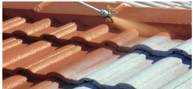
Idéal pour la rénovation des